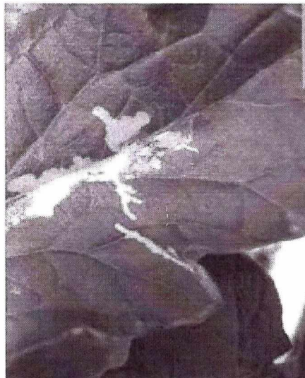
atac pe frunze